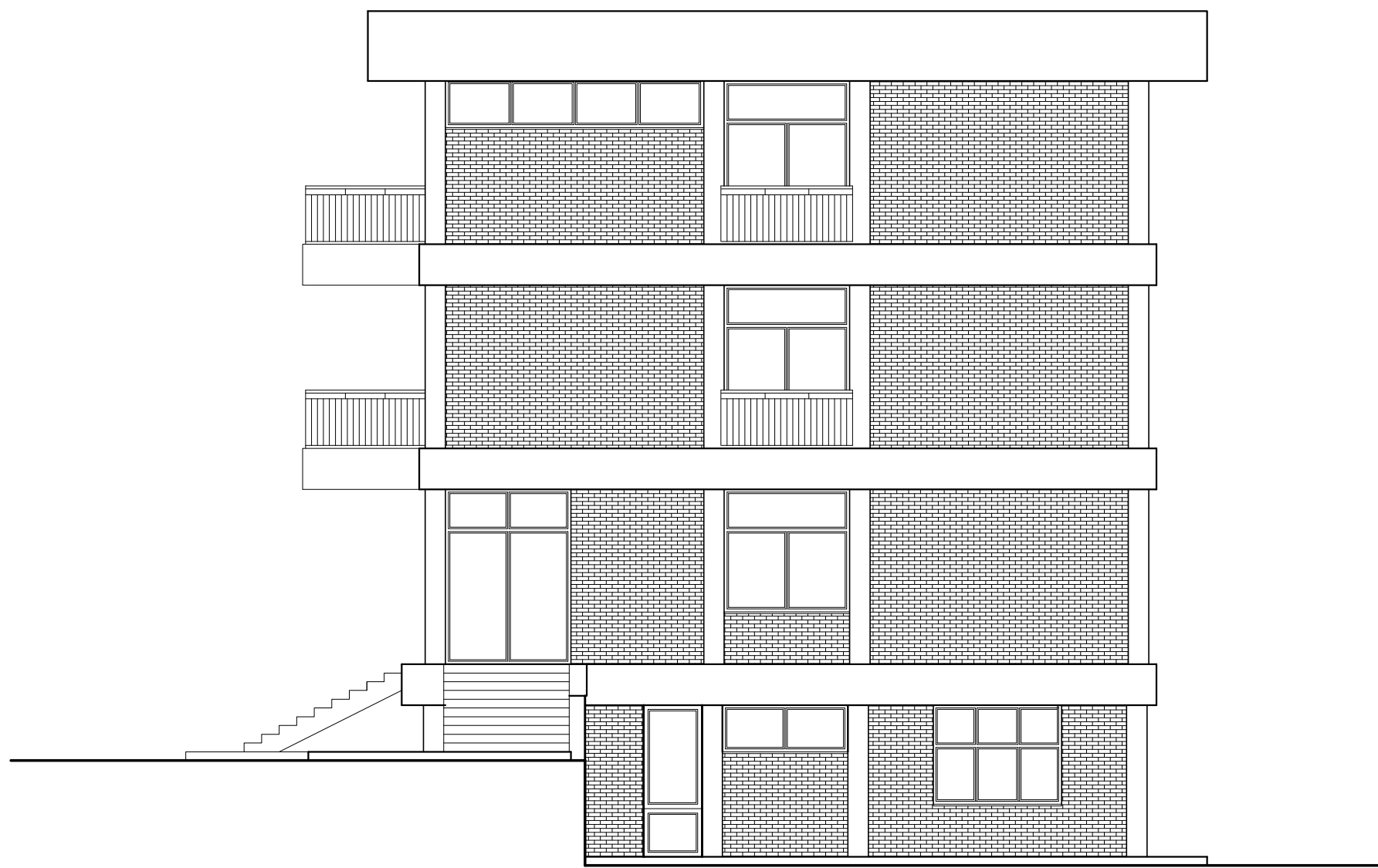
PROSPETTO LATERALE SUD