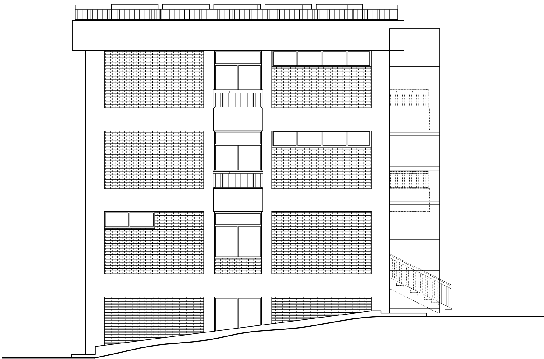
PROSPETTO LATERALE NORD