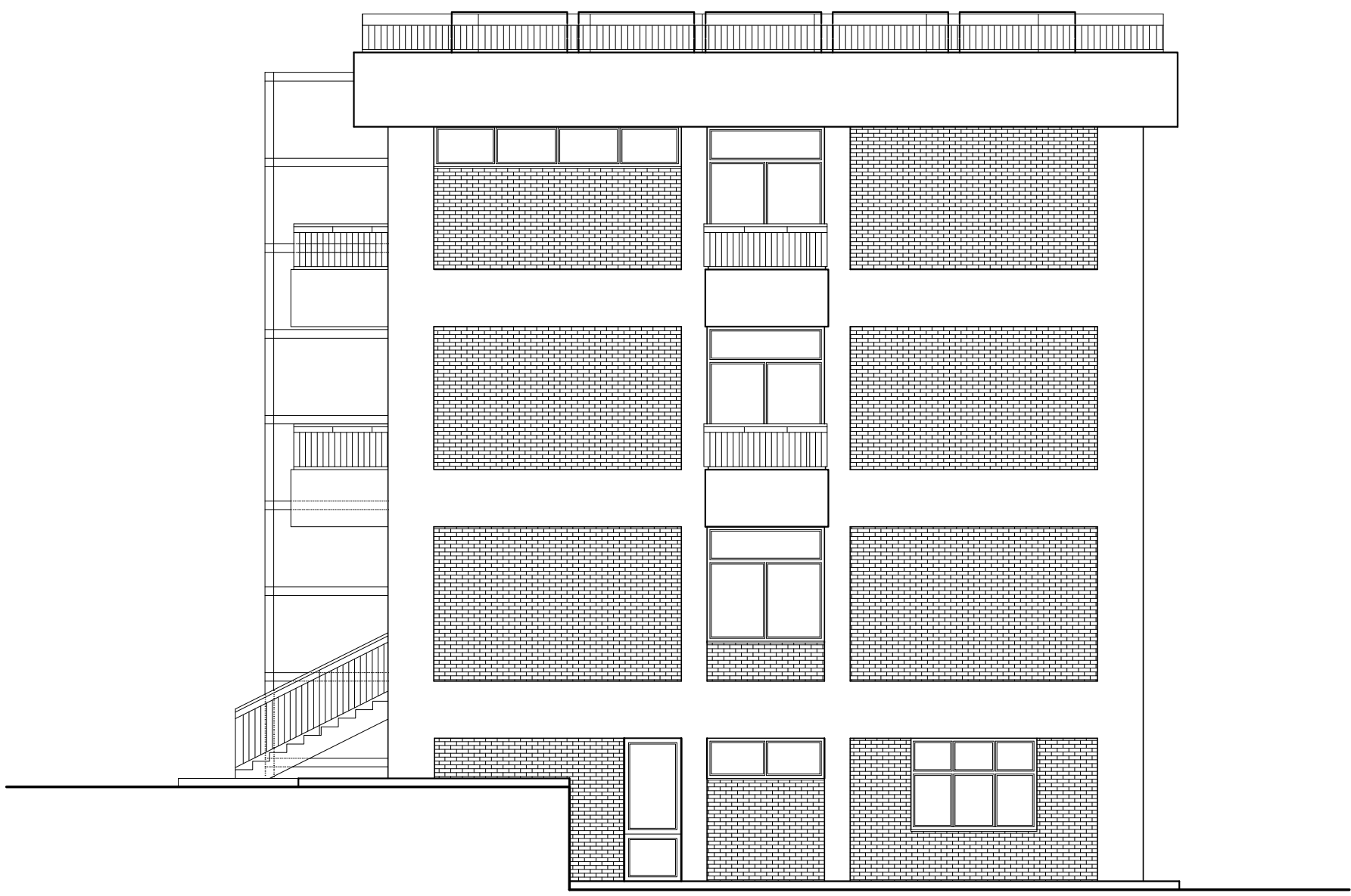
PROSPETTO LATERALE SUD